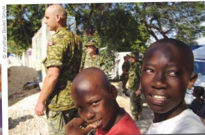
Après le séisme, des militaires canadiens sont venus à l'Arche. Ils ont déblayé les décombres, installé des tentes, creusé des fossés pour éviter les inondations et apporté de l'eau et de la nourriture.

Pour subvenir aux besoins des pensionnaires, l'Arche s'est tournée vers son réseau de soutien au Québec. Les responsables des Arches québécoises ont réuni l'argent pour construire quatre abris temporaires: une baraque pour les femmes, une pour les hommes, une salle communautaire et une salle de bains. Ces abris accueilleront une trentaine de personnes pendant deux ou trois ans. Cela donne le temps de choisir un site plus sécuritaire pour rebâtir l'Arche.