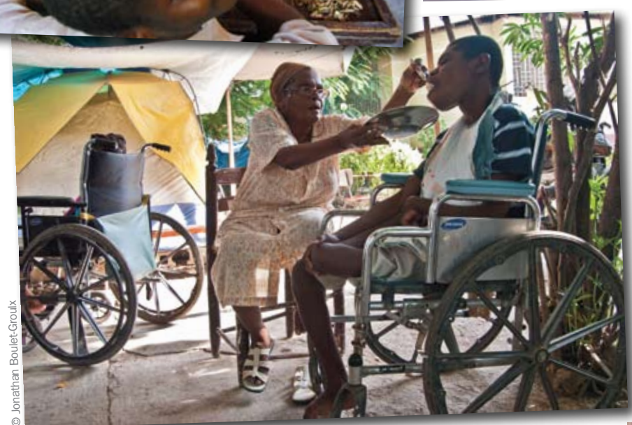
La vie sous la tente n'est pas facile, particulièrement pour les pensionnaires en fauteuil roulant.